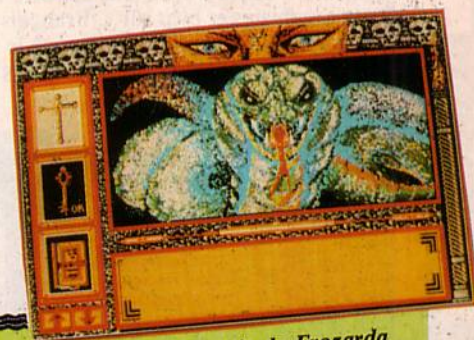
Le Manoir de Frozarda