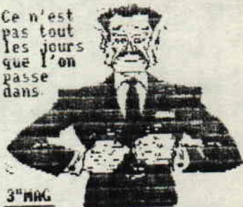
3 o MAG

Ce n'est pas tout les jours que l'on passe dans.