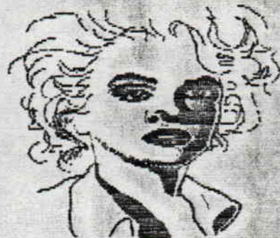
M-S, ce dessin est pour toi...

Pas de tests pour ce numéro de relance, et pas non plus de tops. Vous retrouverez tout ça dans le Noll, sans faute. Je vous rappelle que vous devez envoyer sur papier libre le nom de vos 15 jeux favori (BUDGET, NOTIUEAUTE, VIEILLERIE...) De meme, pour le top musique, indiquez le nom des 3 jeux qui ont selon vous les meilleurs musiques.