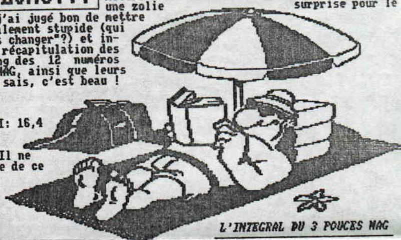
L'INTEGRAL DU 3 POUCES MAG

Numéro 2: SHINOBI: 18,5 BOMB JACK: 15 TURBO GIRL: 15,5