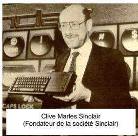
Clive Marles Sinclair (Fondateur de la société Sinclair)