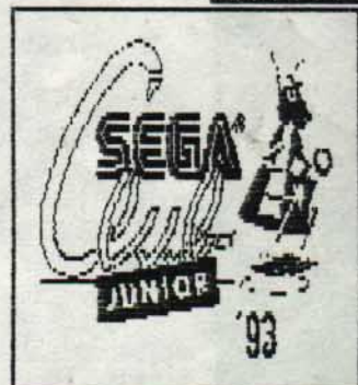
LOGO SEGA CLUB 93