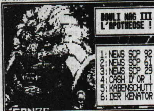
(C) BOULI MAG PRODUCTIONS 1993 NTM

Bouli Mag Le Jerk Supreme, aux éditions SJP, continue son petit bonhomme de chemin. Les Ov Boys viennent de publier une version braille de leur toute dernière cassette vidéo, et ce contre toute attente. Le projet "Margarine De Cheval" ne verra donc vraisemblablement jamais le jour. Bouli Mag III, "l'Apothéose", Editions Section Jerk Power, 199 frs, disponible chez Beef Maxi Discount, ouvert toute la semaine. Carte bleue acceptée.