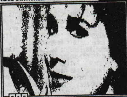
MADAME BRICHTOUILLE

Le premier album de l'Impératrice du rap français, "Madame Brichtouille", vient de sortir chez Sony Music. Son titre: "Z-y vas, casse-toi d'ma zone!" On y retrouve le désormais célèbre "On va s'faire le Leclerc" ainsi que le terriblement hard core "Que mème qu'il est Cash" qui avait en son temps défrayé la chronique. Le son du DJ Terminoustoulmondessan est mégasuper et la tchatche crache méga violemment. A ne pas manquer! 30 frs en CD (avec le pin's).