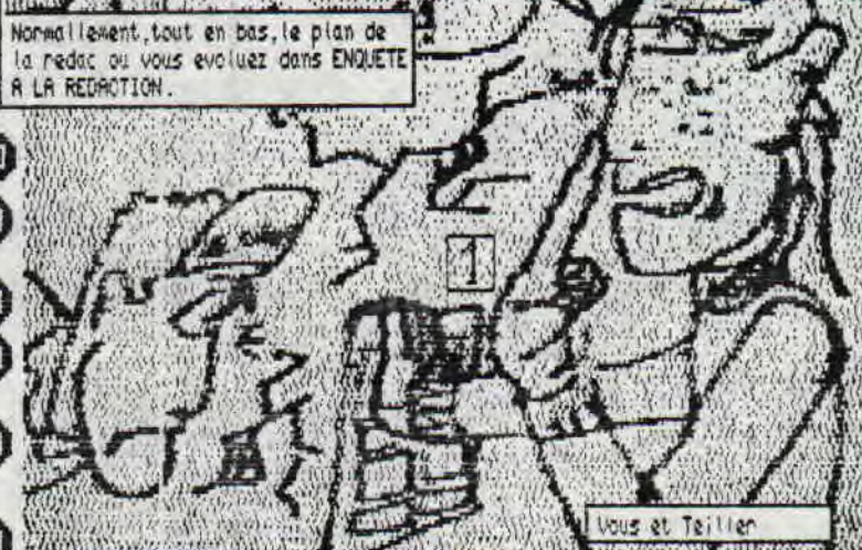
Vous et Teiller

Normalement, tout en bas, le plan de la redac ou vous evoluez dans ENQUETE A LA REDACTION.