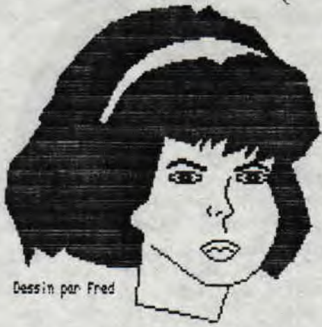
Dessin par Fred