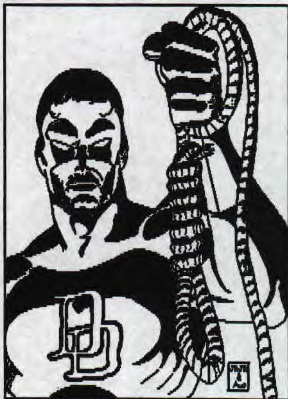
A QUI LE TOUR ?

Tout commença pour la parution du #10 ('SHOT m'a converti aux #!) dans lequel T.R.Nic écrit ses tout premiers articles. Nous passerons sur la sombre histoire de poulet (était-il poursuivi par la police? faisait-il parti de la Mafia? de la Maggia? de la Cosa Nostra? du McDonald d'à côté?). X-cusez moi, la rentrée fut TRES dure. Bref, dès son premier article (KNIGHT FORCE) le ton était donné: "mais qu'est-ce que je raconte là?". Cette question est peut-être bien une des seules intelligentes qu'il posera dans sa vie (avec "To be or not to be, that is the question". Mais là la question ne se pose même pas, je lui conseillerais la 2eme solution). Une de ses occupations favorites dans ses articles c'est de foutre des faux ND des copains et des vrais NONic dans ceux des autres. Je doute qu'il