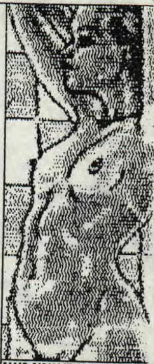
DIGIT PARADISE POUR RESET.

C'est juste pour montrer que le BASIC n'est pas mort!! Je sais, c'est un peu long mais le résultat en vaut la peine, croyez-moi braves gens.