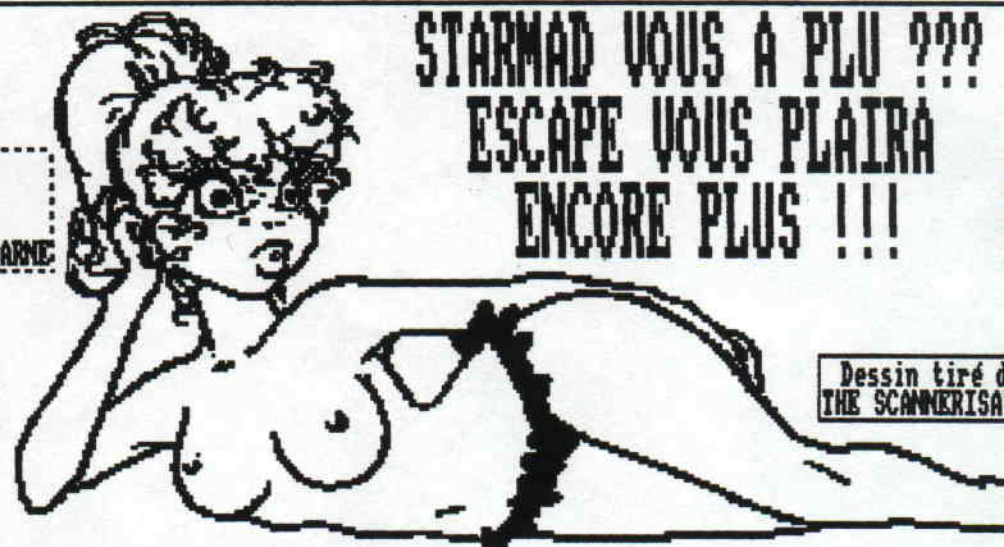
Dessin tiré de THE SCANNERISATOR