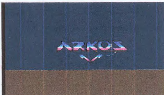
Logo ARKOS au début du fanzine (cf. article)

Voici quelques screenshots pris avec Hypersnap DX Pro (version enregistrée) sur l'émulateur WinApe32 v1.8b (émulation CPC+). Les images peuvent varier de l'émulateur au CPC+, donc ne vous faites pas de fixation sur ces images.