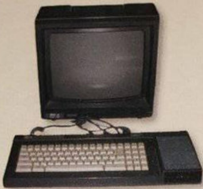
■ Un ordinateur (vers 1985)