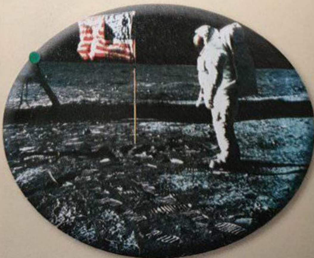
■ Le premier homme sur la Lune (juillet 1969)