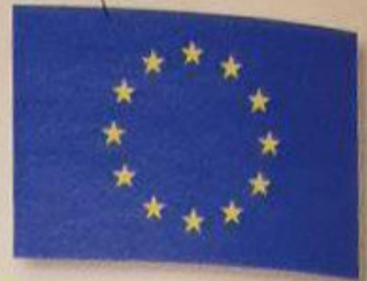
■ Le drapeau de l'Union européenne